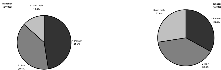
Figur 2 Prozentverteilung (%) der gesamten Anzahl Geschlechtspartner bei den sexuell aktiven Jugendlichen, nach Geschlecht (SMASH 2002, Q67)